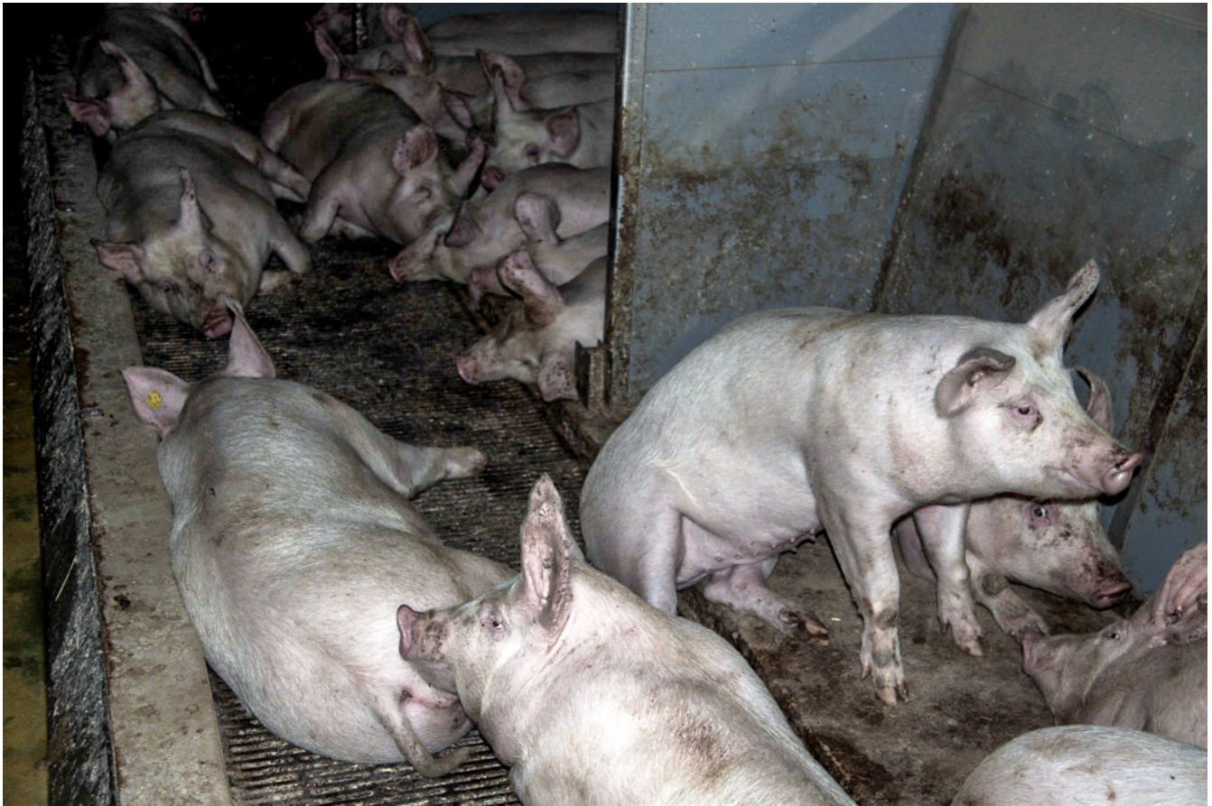
IP-Suisse Schweine im Kanton Bern