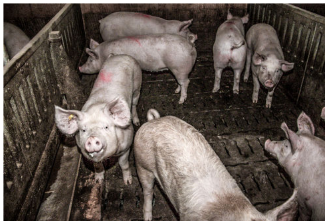
Leben auf Vollspaltenböden

Erfolgreiches Lobbying von TIF brachte den Schweine-Report auch in die Politik. Der grünliberale Berner Grossrat Michel Rudin verlangt in einer Interpellation die Klärung der Missstände. Derweil will der Grüne Nationalrat Bastien Girod seinerseits vom Bundesrat wissen: Wie sind die im Schweine-Report dokumentierten Missstände mit der gesetzlich verankerten Tierwürde, die als Eigenwert des Tieres definiert ist, zu vereinen?